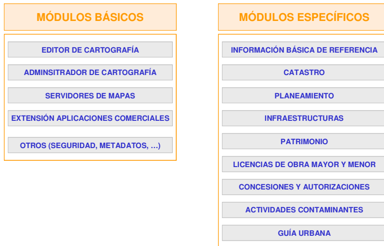
Módulos de GeoPISTA

El Sistema de Información Territorial GeoPISTA dispone de un conjunto de módulos, básicos y específicos. Los módulos específicos pretenden facilitar las tareas rutinarias que diariamente se llevan a cabo en un Ayuntamiento, mediante asistentes guiados, funcionalidades específicas, etc. Están dirigidos especialmente a los técnicos de los Ayuntamientos y no requieren de conocimientos informáticos específicos. Por otro lado, los módulos básicos tienen como objetivo ofrecer las herramientas necesarias para la gestión y administración del sistema completo, sirviendo de base para los módulos específicos. Se trata de módulos más complejos, dirigidos al personal técnico cualificado de los Ayuntamientos.