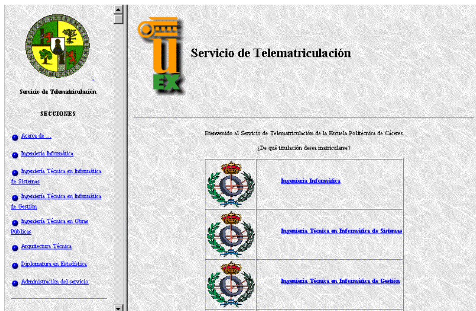
Figura 1 Página principal del Servicio de Telematriculación

La interfaz de usuario del sistema está basada en hipertexto. Cuando el usuario accede a nuestro servicio, se le lleva a la página principal que se puede ver en la figura 1. En la parte izquierda de la página se puede ver un menú de acceso rápido, con enlaces a las distintas secciones del Servicio de Telematriculación. La parte derecha de este documento inicialmente mostrará la página de presentación del servicio y servirá posteriormente para que el usuario visualice las páginas a las que acceda mediante los hiperenlaces del sistema.