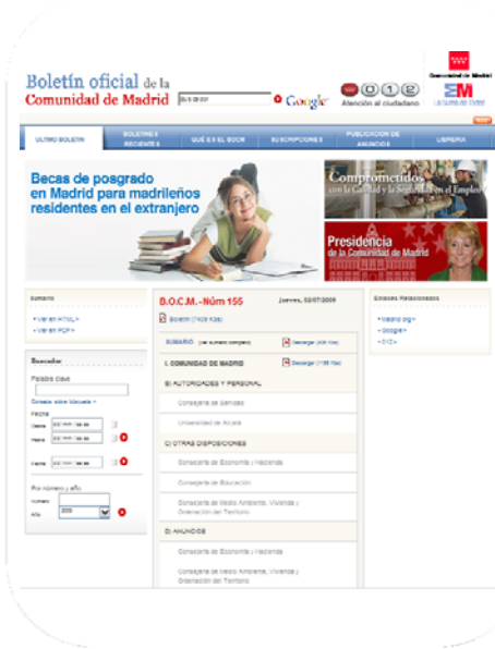
Páginas vistas web BOCM en 2009

En 1998 la Comunidad de Madrid, complementó la edición impresa con un portal web de consulta, integrado en madrid.org, que ofrecía al ciudadano la publicación diaria del periódico en HTML y pdf, así como un buscador sobre el histórico de boletines.