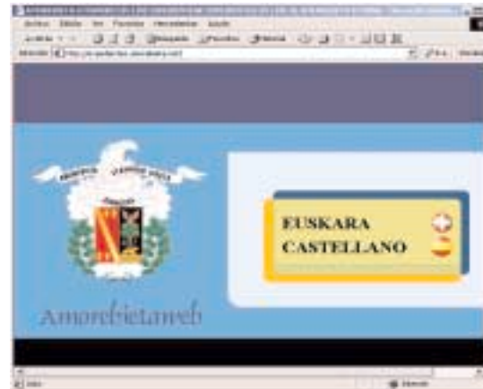
Figura 1. Menú Presentación