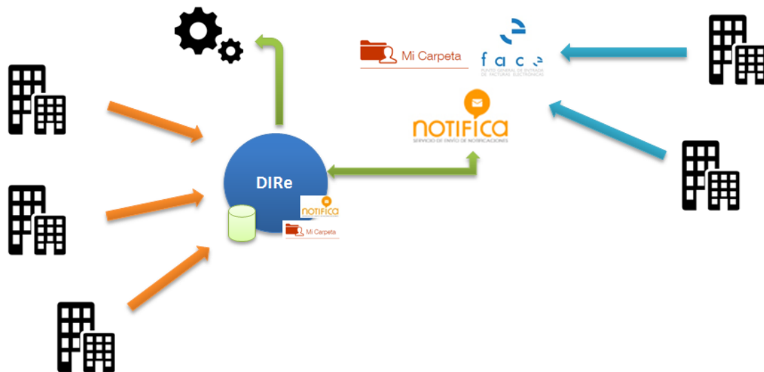
Ilustración 2: Modelo DIRe

DIRe permitirá tanto actualizar información propia de DIRe como aquella información que otros sistemas deseen sea mostrada y con posibilidad de actualización desde DIRe, como por ejemplo NOTIFICA.